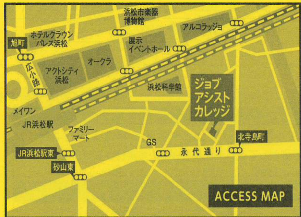
「訓練実施会場」案内図